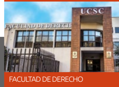
FACULTAD DE DERECHO

Universidad Católica de la Santísima Concepción